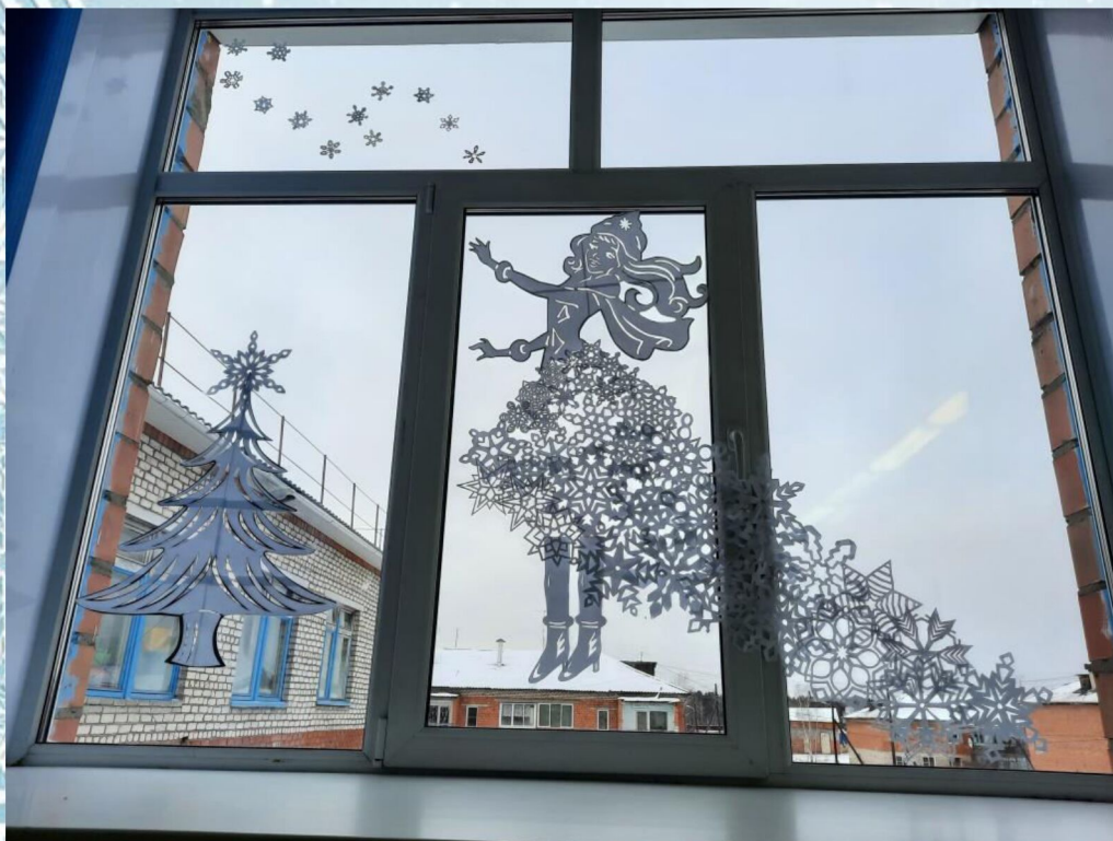
2 место СКШ г. Вихоревка