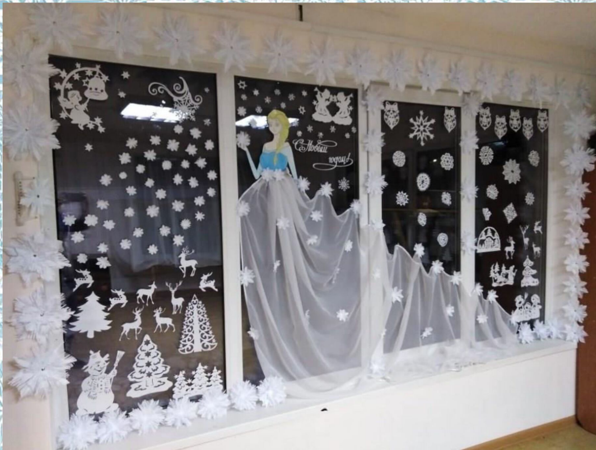
1 место Школа-интернат пос. Целинные Земли