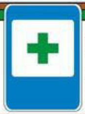
Знак "Пункт первой медицинской помощи"