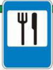
Знак "Пункт питания"